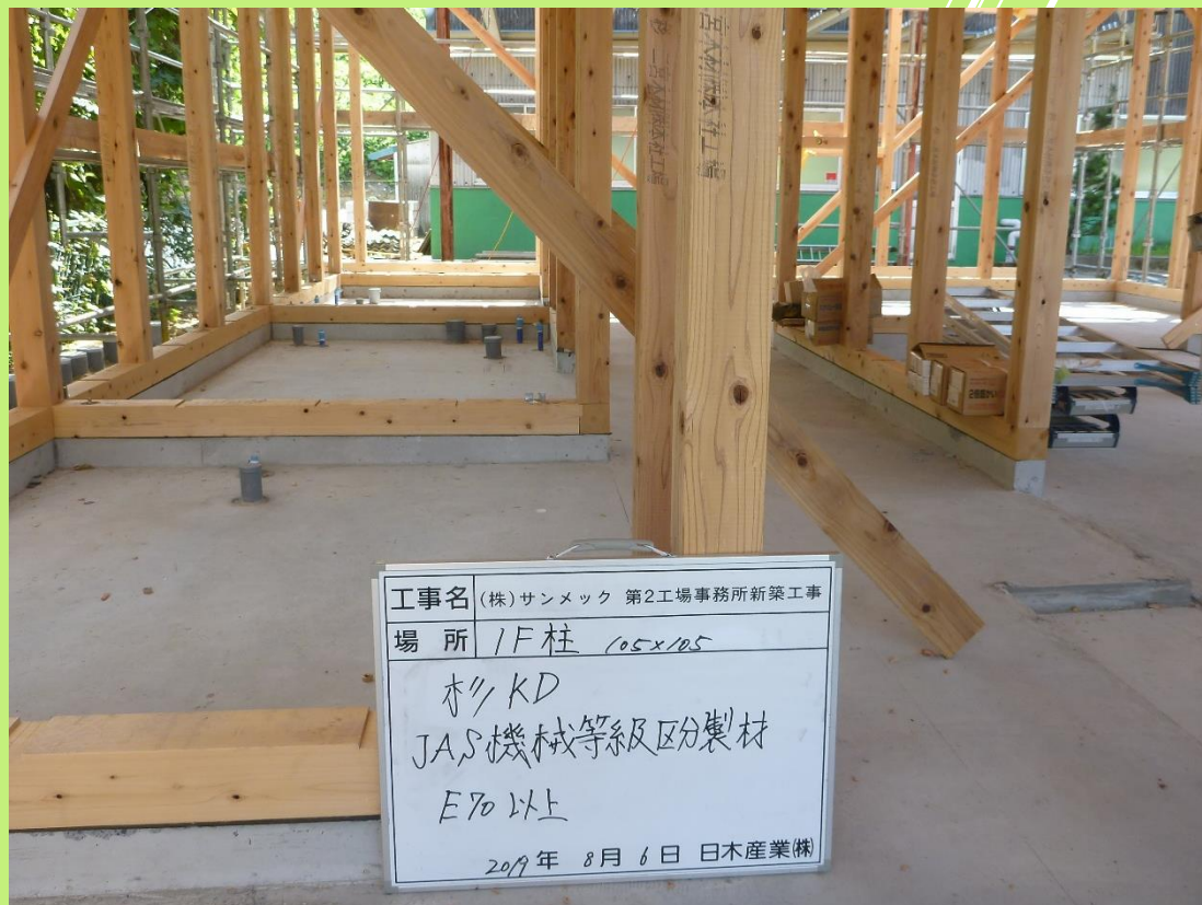
<柱：杉KD JAS機械等級区分構造用製材 E70>