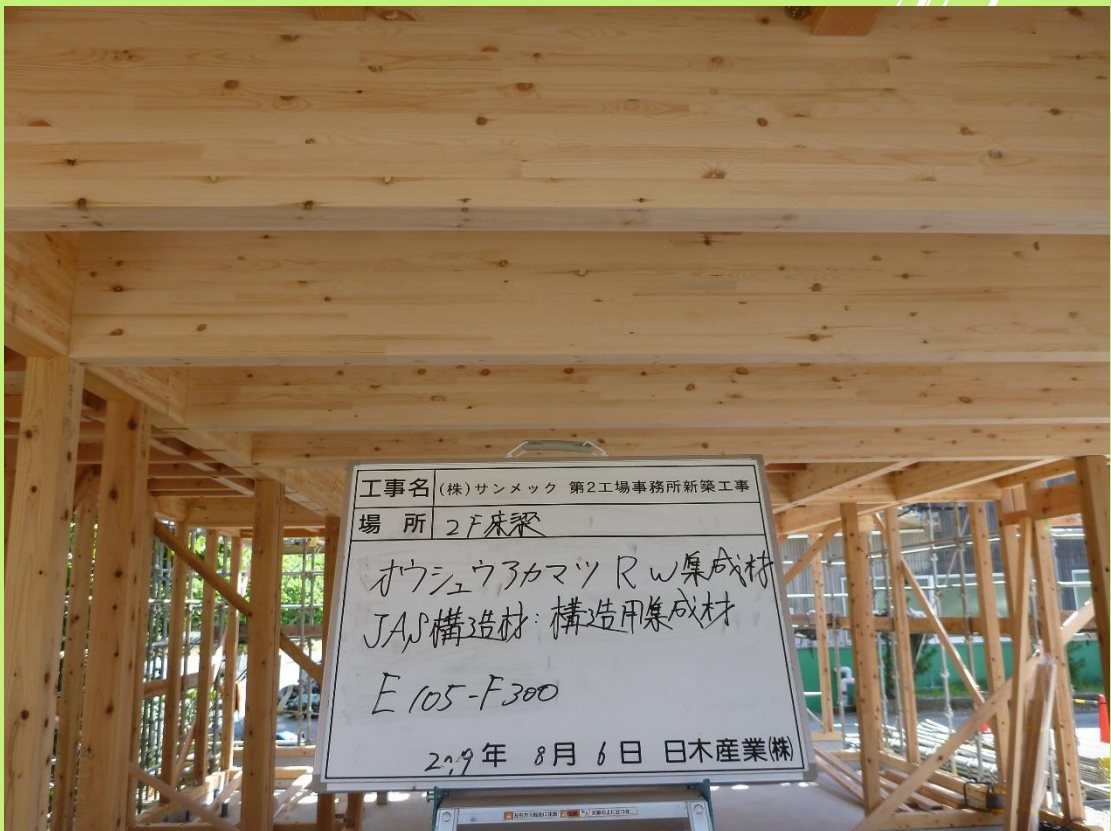
〈梁：オウシュウアカマツ集成材 JAS構造用集成材 E105-F300〉